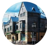
Исторический финский город Сортавала