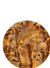
Музей Кронида Гоголева