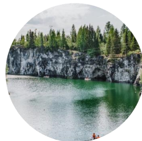
Горный парк Рускеала